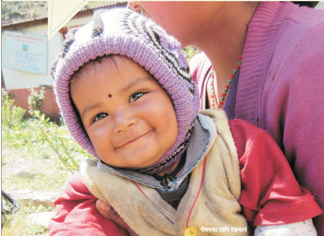
पोषणका लागि सहकार्य